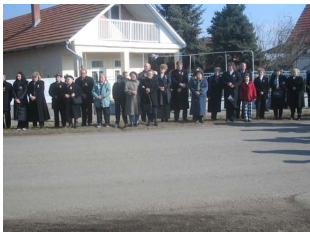
2005. március 15.